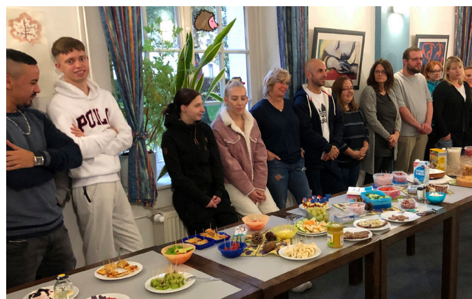
Erster Testlauf: Fliedners Pflege-Azubis aus Mülheim präsentieren „eat by walking“.