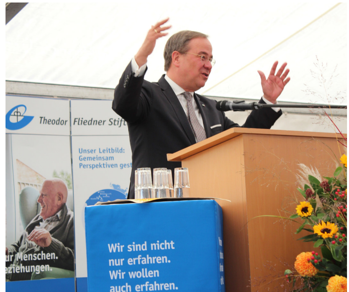
Armin Laschet auf dem Festakt der Theodor Fliedner Stiftung zum 175. Jubiläum.

Pfarrer Theodor Fliedner sah 1844 die Nöte der Menschen und wollte nicht nur die unmittelbare Situation ändern, sondern Hilfeleistungen in eine nachhaltige Form bringen, er dachte immer einen Schritt weiter. Die Stiftung führt diesen Gedanken fort, alle schaffen gemeinsam eine Perspektive. Es geht darum, bestehende Angebote immer weiterzuentwickeln und so aktuell zu halten. Heute reicht