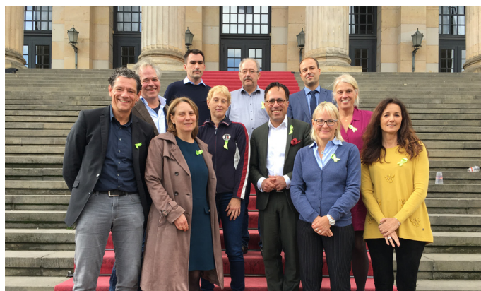
Ein Zeichen der Akzeptanz für seelische Erkrankungen: Die grüne Schleife, getragen von den Verantwortlichen aller Fliedner Kliniken und dem Krankenhaus.