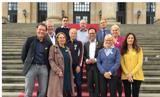
Ein Zeichen der Akzeptanz für seelische Erkrankungen: Die grüne Schleife, getragen von den Verantwortlichen aller Fliedner Kliniken und dem Krankenhaus.

Klein, aber oho: In der Psychiatrischen Institutsambulanz und Tagesklinik bietet die Fliedner Klinik Gevelsberg im überschaubaren Rahmen eine freundliche, auf die individuelle Not und Problematik des Einzelnen zugeschnittene Therapie auf hohem wissenschaftlichem Niveau an. Ängste und Vorbehalte der Patienten gegenüber einer psychiatrischen Behandlung legen sich fast immer nach kurzer Zeit. Auf dem Boden einer akzeptierenden therapeutischen Beziehung wachsen das Vertrauen in die eigenen Stärken und die Motivation zu positiven Veränderungsschritten und zur gezielten Bewältigung von Problemen. Auch der Umgang mit eigenen Bedürfnissen, Werten und Grenzen wird durch die Therapie zunehmend gestärkt. In der Tagesklinik behandelt das Team um Chefarzt Dr. Marc-Andreas Edel Patienten verschiedenen akuten psychischen Störungen, in der Ambulanz darüber hinaus Menschen mit psychischen Störungen im höheren Lebensalter, ADHS und hochfunktionalen Autismusspektrum-Störungen im Erwachsenenalter.