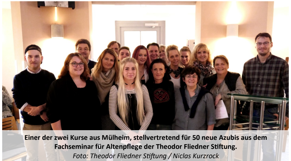
Einer der zwei Kurse aus Mülheim, stellvertretend für 50 neue Azubis aus dem Fachseminar für Altenpflege der Theodor Fliedner Stiftung.