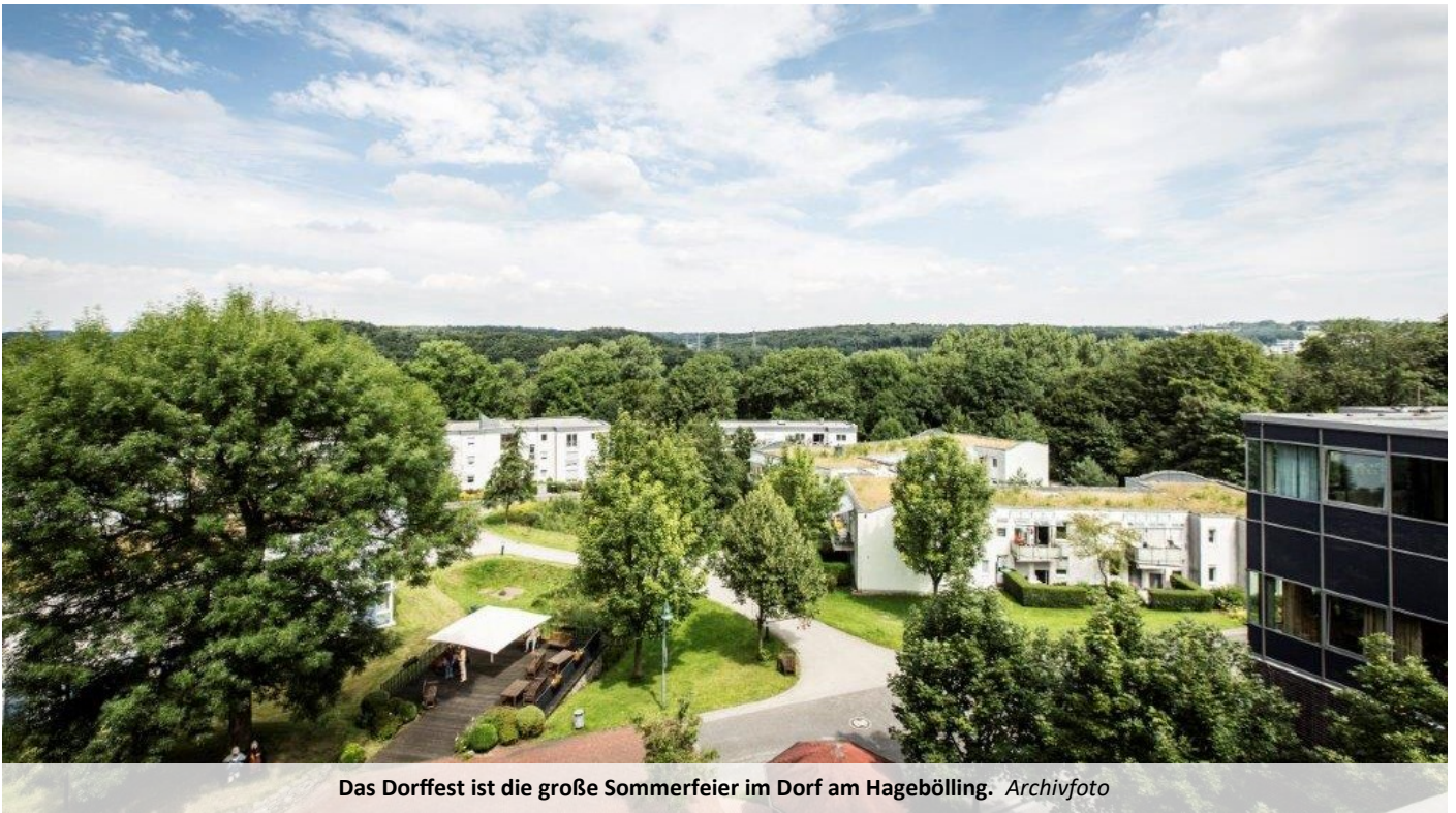
Das Dorffest ist die große Sommerfeier im Dorf am Hagebölling.

Zum 20-jährigen Bestehen der Einrichtung